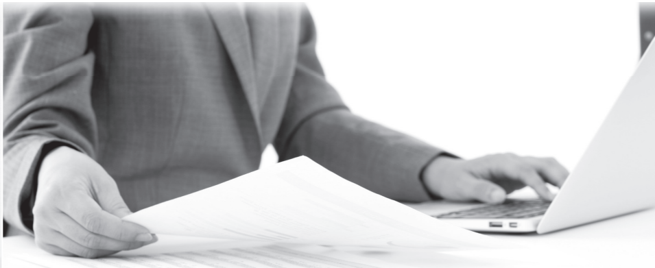
監査人の監査実施状況のチェック