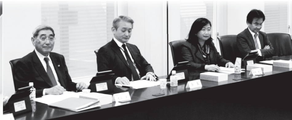
監査制度及び監査環境の整備・充実に必要な施策の検討