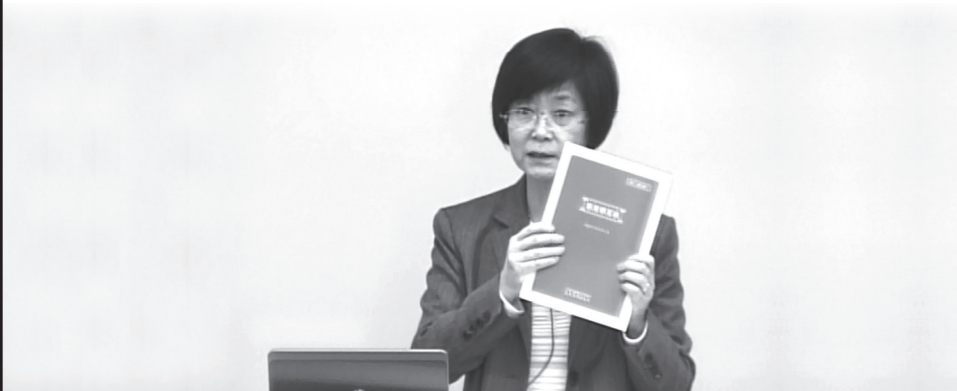
監査人が業務上注意すべき事項の周知