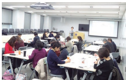
リスタート応援研修