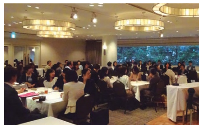
女性会計士フォーラム