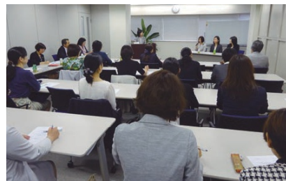
地域会女性会計士イベント