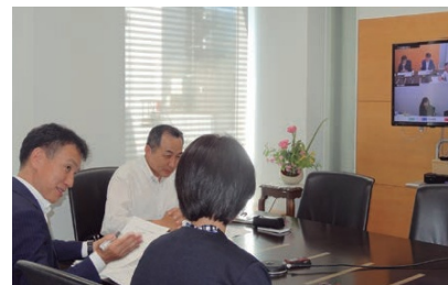
ワークライフバランス等に関する意見交換会