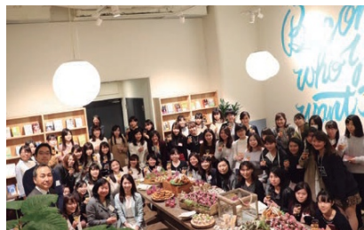
女子学生向けイベント