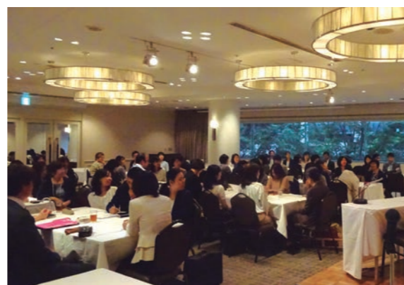
女性会計士フォーラム