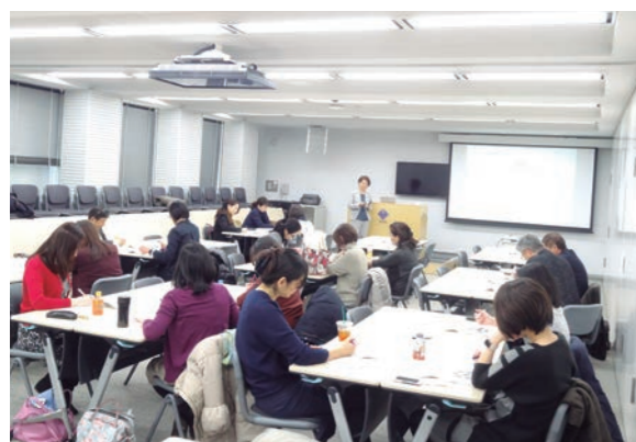
リスタート応援研修