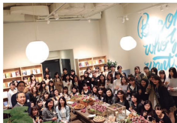
女子学生向けイベント