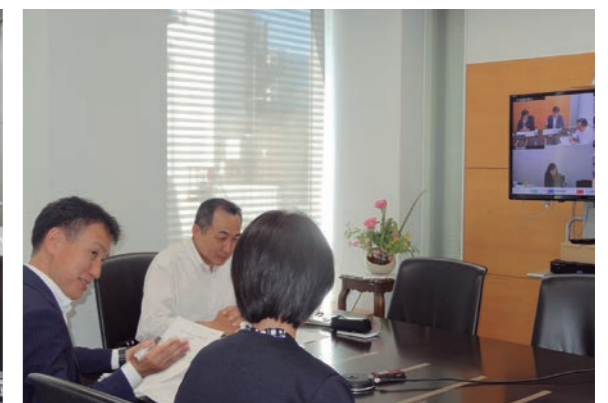
ワークライフバランス等に関する意見交換会