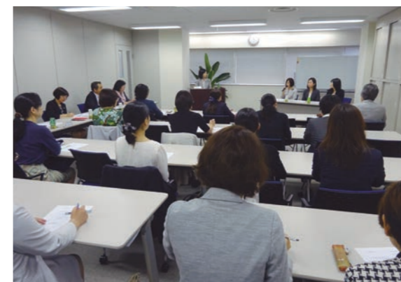
地域会女性会計士イベント