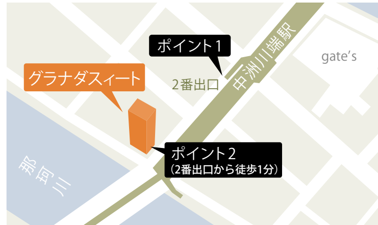
中洲川端駅からの道順拡大地図